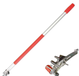
SPEEDY ROLL pag. 326